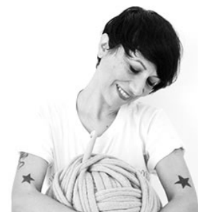
di GAIA SEGATTINI

Forse vi ricorderete il caso dei maltrattamenti all'Asilo Cip Ciopi di Pistoia: quegli spezzoni video sgranati, le botte, i bambini che sembravano pupazzi immobili. Una delle bambine a casa aveva cominciato a picchiare la sua bambola come gli insegnanti con lei: uno dei segnali di aiuto che avevano